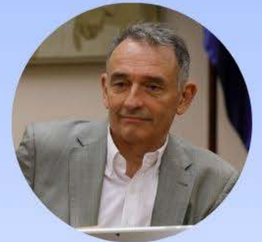
ENRIQUE SANTIAGO. SUMAR