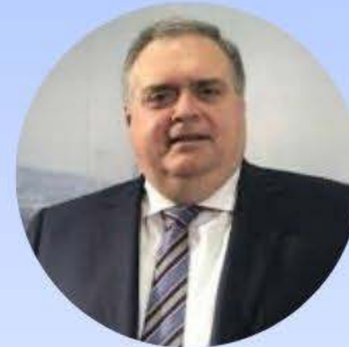
TXEMA OLEAGA. PSOE